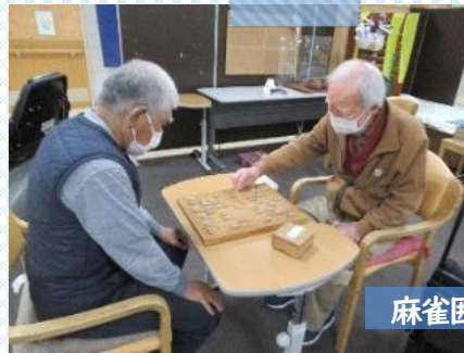
麻雀囲碁将棋倶楽部