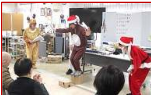
職員の出し物で盛り上がりました。