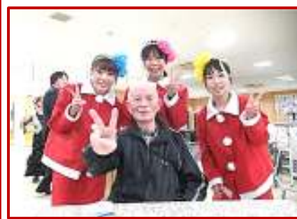
令和の『キャンディーズ』