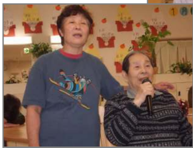
皆さんカラオケが大好きですね！！