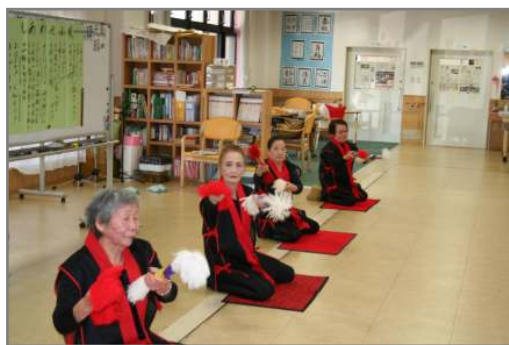
葵風会の皆さんの 銭太鼓は迫力満点！！